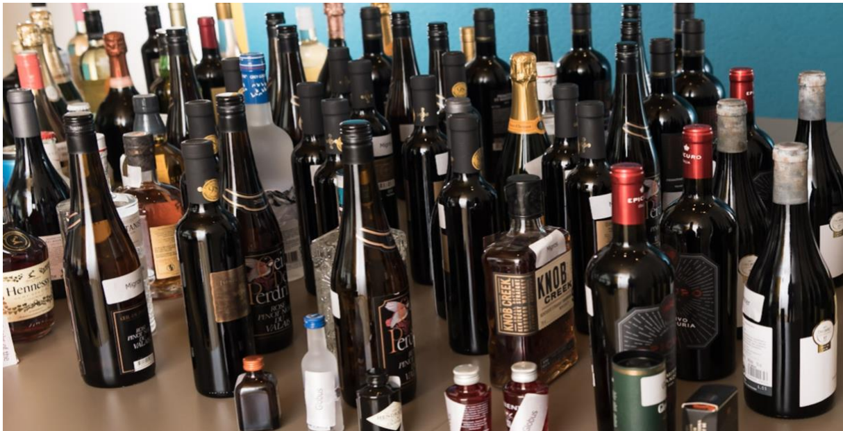
"Alles jederzeit zu kriegen!" – Bild der Lieferungen an Jugendliche, BKZH-Testkäufe 2022